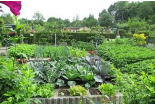
Die Kombination aus Kompost und Pflanzenkohle macht den Unterschied – gesunde Pflanzen mit hoher Widerstandskraft.