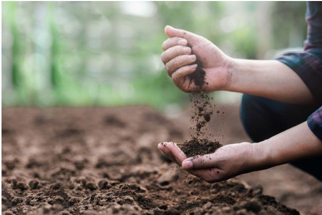
Kompostierung im Kleingarten