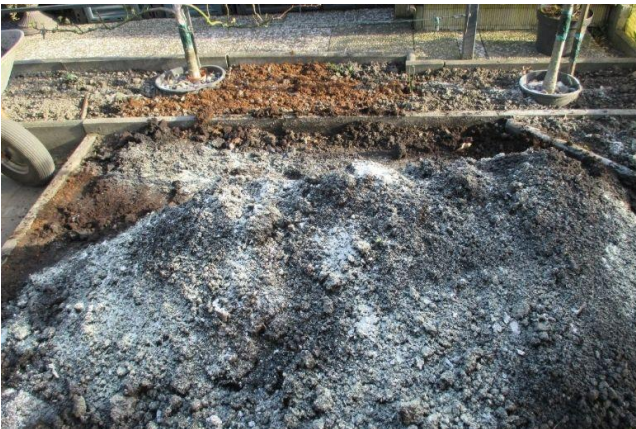
Pflanzenkohle und Gesteinsmehle sind die Grundlage für eine gelungene Transformation des Grünabfalls zu Terra Preta.

Eine weitere bedeutende Eigenschaft im Hinblick auf die Nährstoffdynamik ist die hohe Kationenaustauschkapazität (KAK) . Sie beschreibt die Fähigkeit der Pflanzenkohle, positiv geladene Ionen (Kationen) an ihrer Oberfläche zu binden und bei geeigneten Bedingungen wieder für Pflanzen und Mikroorganismen verfügbar zu machen.