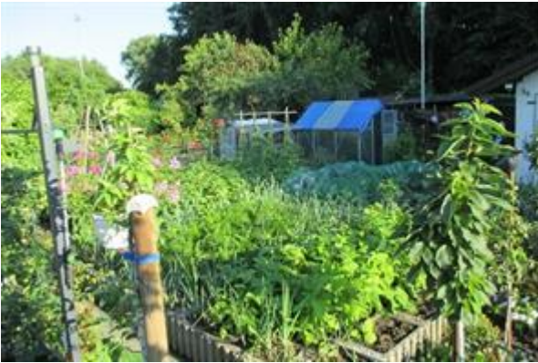
Erfolg auf ganzer Linie: Terra Preta zeigt in der Kleingartenanlage Batenbrock ihr volles Potenzial.