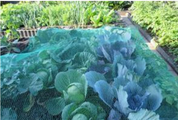
Kohlgemüse auf Terra-Preta-Boden: Kräftiger Wuchs und gesunde Blätter dank optimaler Nährstoffversorgung.