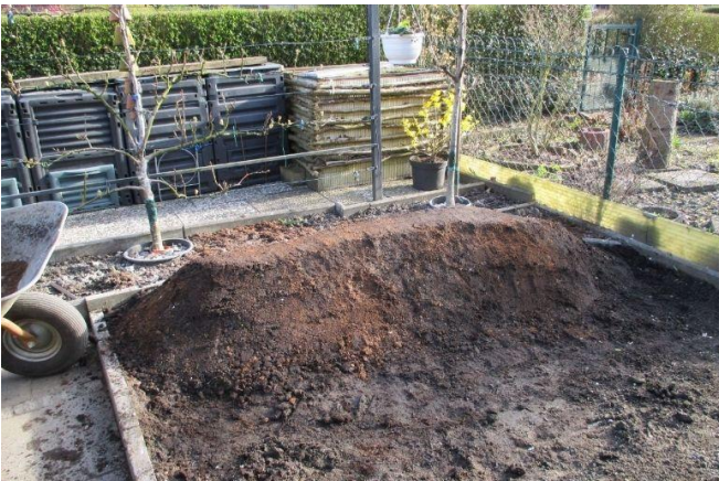
Pflanzenkohle-Kompost aus eigener Herstellung.