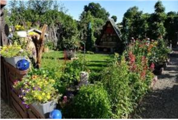
Blühende Vielfalt im Kleingarten – auch Zierpflanzen profitieren sichtbar von der nährstoffreichen Terra Preta.