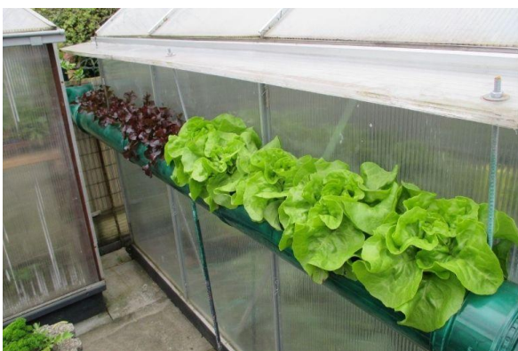
Erfolgreiche Anwendung von Terra Preta auch außerhalb des gewachsenen Bodens.

Eine Frage wird mir immer wieder gestellt: Was ist Terra Preta? Wie stellt man sie her – und was braucht man dafür? Das erläutere ich gerne in diesem Artikel.